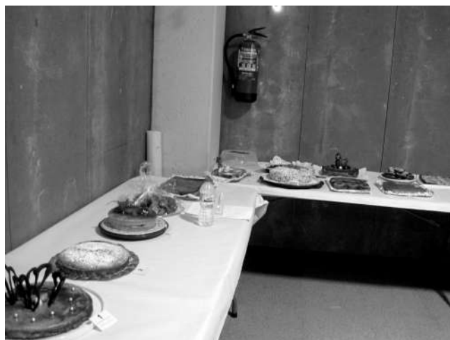
El concurs de coques i pastissos va tenir un bon nombre de participants

El migdia el dinar popular va agrupar a una important part dels veïns del municipi i alguns familiars i amics, fent d'aquest un acte molt festiu i agradable.