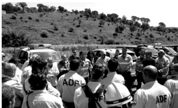
Cap operatiu de Bombers en la xerrada posterior

En aquest cas es van aplegar un centenar de voluntaris i una vintena de vehicles lleugers.