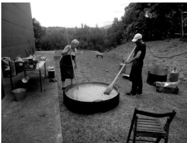
Moment en que els cuiners preparaven l'arròs. A l'esquerra imatge del dinar