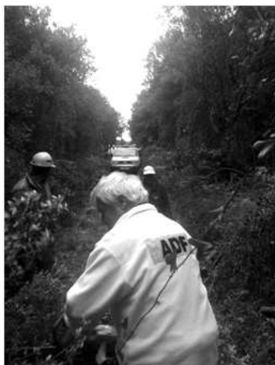
Voluntaris en plena actuació

El passat diumenge 7 de maig, 3 voluntaris de la nostra ADF van participar, a Figueres, en el dispositiu previst pel castell de focs artificials de les festes de la Santa Creu. Malgrat haver-hi un parell d'ensurts i cremar-se dues petites superfícies de rostoll, el foc no va anar a més.