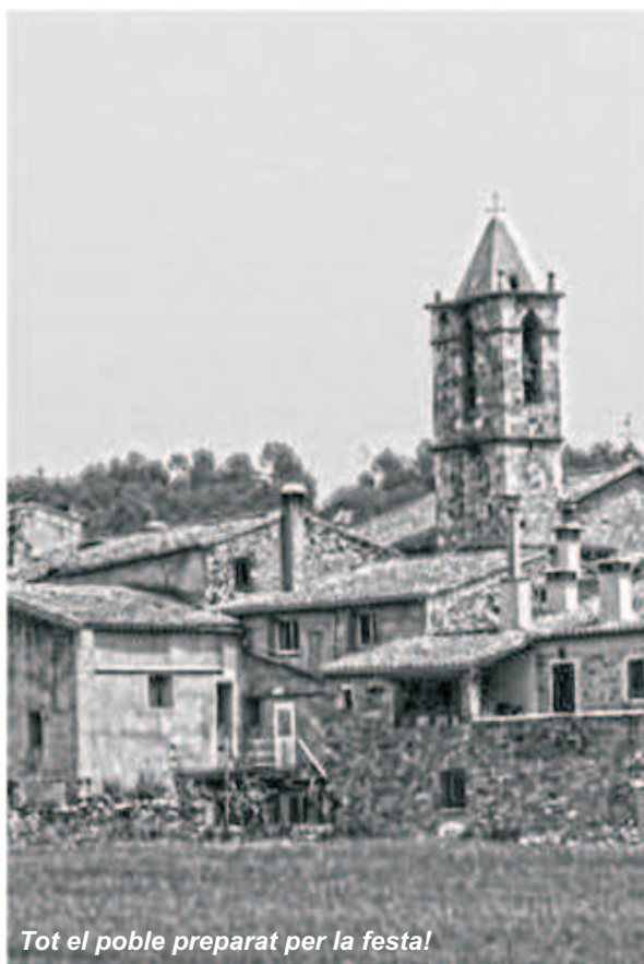
Tot el poble preparat per la festa!

Un any més arriba la festa més gran d'Espinavessa i aquest any ho fa carregada de novetats