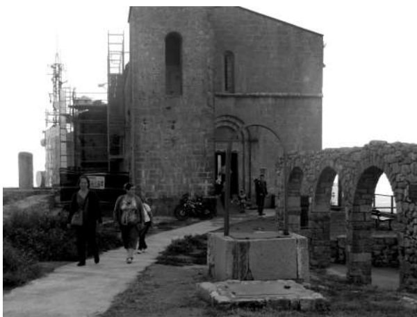
Després de la missa es va baixar al local polivalent

Gracies a tothom per haver vingut i participat, l'any vinet i tornarem i esperem tenir més sort i poder fer el dinar de germanor al pla de Sous.