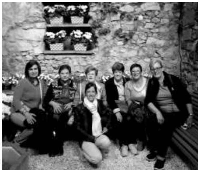
Imatge del grup de dones en un dels patis de Girona