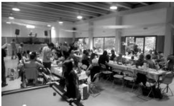
La pluga va obligar a fer el dinar de la romeria al local polivalent.

El diumenge 3 de juny vam pujar a la mare de Deu del Mont com cada any per celebrar la Romeria de Cabanelles.