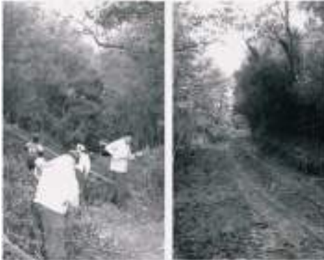
L'aspecte de la pista ha canviat completament després dels treballs de l'ADF

Hem acabat finalment la carretera de Can Camps. Estava molt embardissada i ens ha portat més feina de la prevista, però ja l'hem obert de cap a cap.