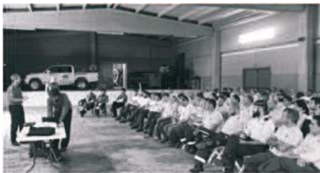
Voluntaris el dia 2, durant la xerrada i els exercicis