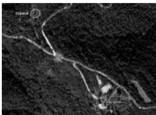
Vista aèria del dipòsit de Can Serra

El ple del dia 9 de maig va aprovar el conveni entre la Diputació de Girona l'Ajuntament de Cabanelles i la propietat dels terrenys on s'ubica el dipòsit d'aigua per extinció d'incendis de Can Serra.