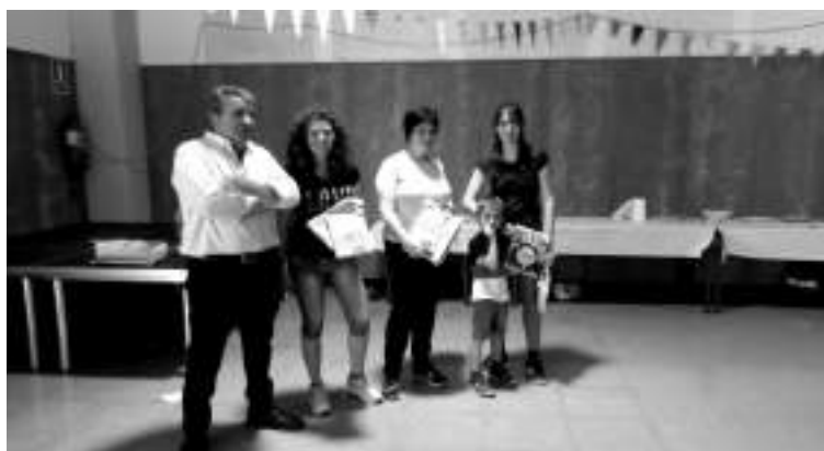
Les tres guanyadores del concurs de coques i pastissos

El dissabte vam tenir un dia molt assolellat que ens va permetre gaudir dels inflables durant tot el dia amb la mainada i d'un bon dinar al local polivalent.