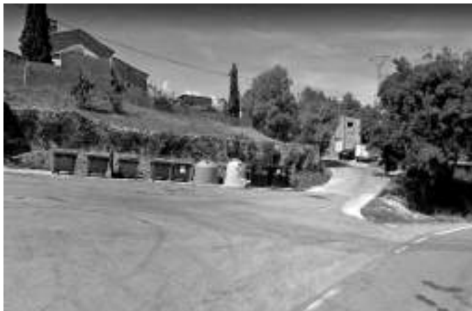
Imatge d'alguns dels contenidors que s'han redistribuït

Per anar millorant tot això, amb la prova pilot de recollida d'orgànica porta a porta a Espinavessa, que de funciona molt bé (i que esperem poder estendre) i amb la redistribució d'alguns punts de contenidors com el de Cabanelles, esperem anar reduint les tones de rebuig que es recullen i poder reduir les tones que aportem a l'abocador comarcal.