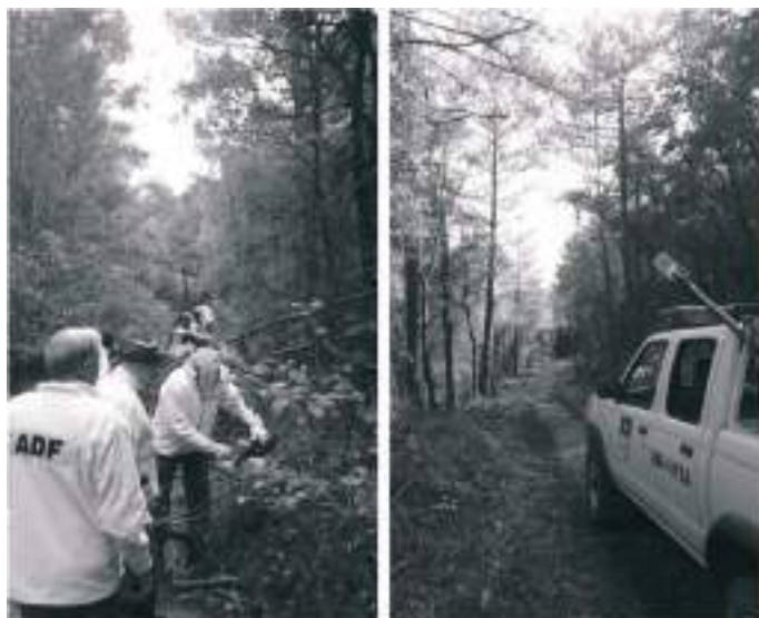
ADF Cabanelles és compromís amb el municipi i els seus veïns