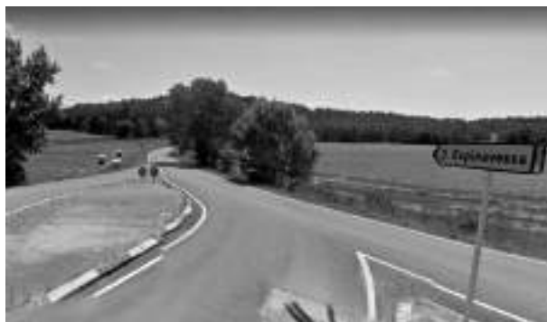
Imatge de l'accés a la carretera d'Espinavessa

Des de la Diputació de Girona ens han informat que tenen previst actuar durant els dies 2 a 8 de maig a la carretera GIV-5122, a Espinavessa. L'actuació consistirà en la rehabilitació superficial del ferm que suposarà, a més d'algunes interrupcions puntuals de trànsit durant les obres, una limitació de velocitat pel risc de lliscaments durant uns 15 dies. Durant aquesta campanya es revisarà el sistema de drenatge. Després de l'execució del tractament superficial es tornarà a renovar la senyalització horitzontal.