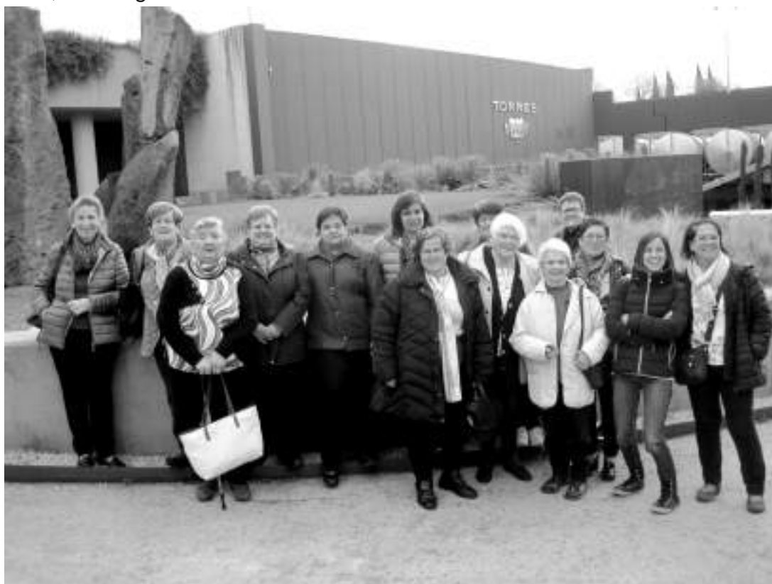
Foto de grup davant les bodegues Torres de Vilafranca del Penedès

A la tarda, i per acabar el dia amb un toc dolç, tocava visita guiada a la fàbrica de "Xocolata Simon Coll", i com no, amb degustació inclosa!