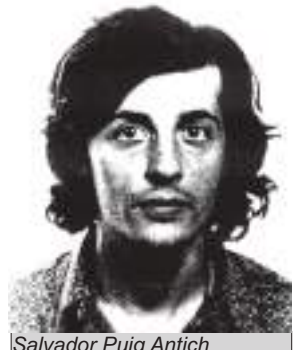
Salvador Puig Antich

En aquells moments aquí a Espanya, potser amb més raó per dir-li en Franco del NODO, quelcom semblant possiblement s'hauria acabat fent la mateixa fi que el pobre Puig Antich. Però el que m'ha fet recordar aquest últim episodi, ha estat la notícia que un cantant de rap ha estat condemnat a tres anys i mig de presó per enaltiment del terrorisme i per injúries al rei. No m'agraden aquests cantants de rap però molt menys el veredict i la pena imposades.