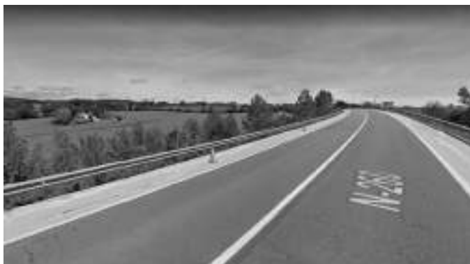
Tram de la N-260 on es faran els treballs de manteniment

Segons informació rebuda del Ministeri de Foment, per tal de dur a terme treballs de manteniment al terraplè de la Caseta, es tallarà la carretera N-260 en un dels sentits i es desviarà el trànsit per l'antiga N-260 en el tram de Queixàs a la guixera. Abans de desviar el trànsit repararan les zones malmeses de l'antiga N-260.